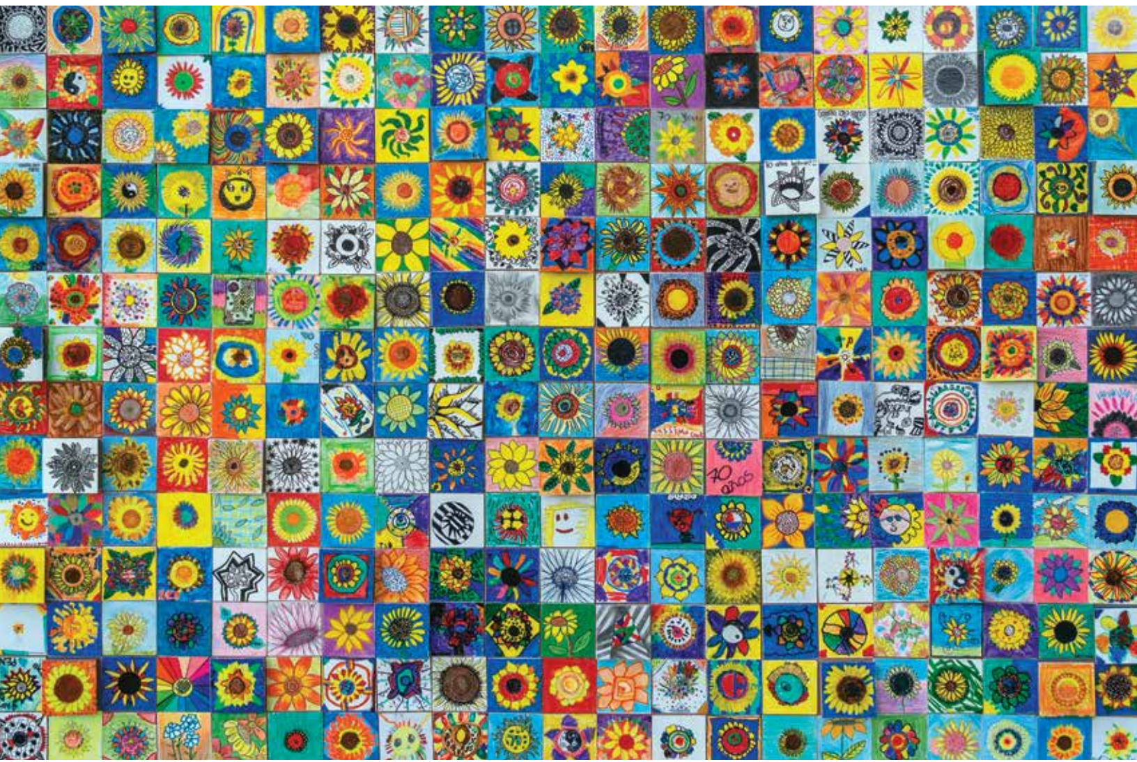
Buscando la Luz , Proyecto Primaria Celebración 70 Años Colegio Bolívar: Collage en vinilos, plumones y lápices de color sobre madera

Derechos y Deberes de la Comunidad Bolívar